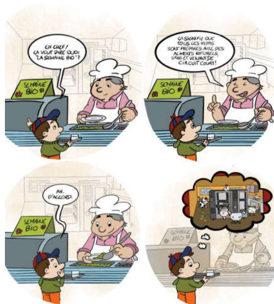
La semaine du BIO vue par CHLOE