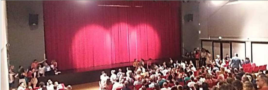
Au Préalambule de Ligné, quelques minutes avant le très attendu lever de rideau.

Le 13 juin 2023, le collège Agnès Varda présentait aux familles de ses artistes en herbe son spectacle de fin d'année au Préalambule. Au programme, sketches, musique, danse, sport et créations des élèves autour d'un titre : « Varda fait son cinéma ».